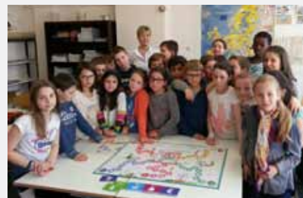
Classe de CM1 de Pfulgriesheim (Alsace)

Dans le cadre du programme initié en 2015 par la Fédération française bancaire, « J'invite un banquier dans ma classe », de nombreux conseillers de F&P ont été sollicités. Ils ont